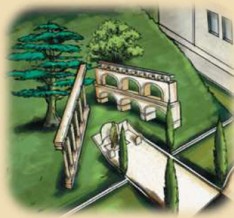
Représentation visuelle du Monument aux Morts

Enfin, une allée de cyprès viendra s'implanter tout le long de l'accès au monument pour attirer le regard et venir souligner l'importance et la solennité de ce lieu.